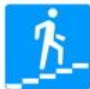
Знак 6.7. Надземный пешеходный переход

Если нет подземного или надземного пешеходного перехода, можно перейти по наземному пешеходному переходу