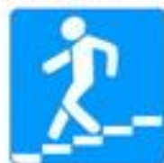
Знак 5.19.1. Подземный пешеходный переход