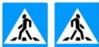
Знаки 5.19.1 и 5.19.2. Пешеходный переход

Если нет подземного или надземного пешеходного перехода, можно перейти по наземному пешеходному переходу