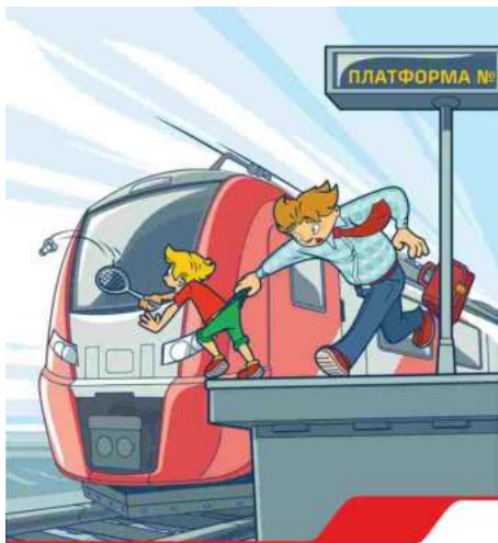
Железная дорога – не место для игр!