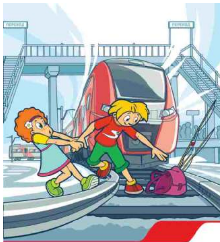
У поезда очень высокая скорость, он не сможет остановиться мгновенно. Переходи железнодорожные пути только в разрешенных местах!