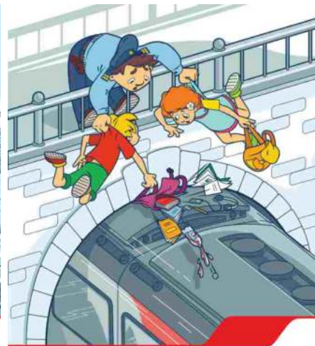
Проезд на крышах и подножках вагона опасен и может стоить жизни!